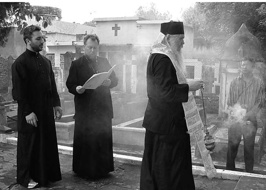
На старом русском кладбище в Асунсьоне епископ Иоанн Каракасский, священник и диакон из США (РПЦЗ) 26 октября 2013 года в день празднования 85-летия храма совершают панихиду